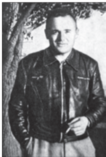
• С.П. Королёв. 1948 год.