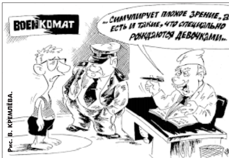
Рис. В. КРЕМЛЕВА.

Телефон автоматической справочной — 783-34-44.