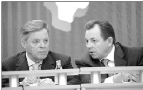
• Губернатор Московской области Борис Громов и председатель Московской областной Думы Валерий Аксаков.

ПРЕДСТАВИТЕЛИ 343 муниципалитетов Подмосквы приехали в город Раменское для работы в съезде, одной из задач которого было создание Ассоциации «Совет муниципальных образований Московской области». С докладом «Об утверждении Устава Совета муниципальных образований Московской области и подписании Учредительного договора по созданию Совета муниципальных образований Московской области» выступил первый заместитель председателя Московской областной Думы Владимир Алексеев. Для членов Совета было решено установить вступительный взнос в размере 0,01 процента от доходной части муниципального бюджета, причем взнос со вновь образованных муниципальных образований (а их большинство) не взимается.