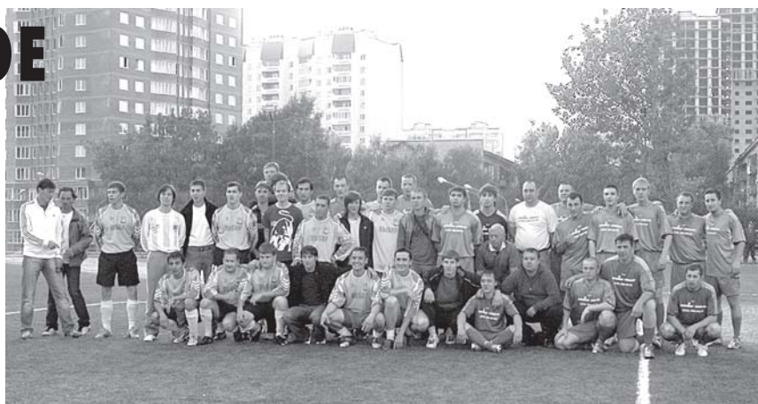
• Фото на память после игры.