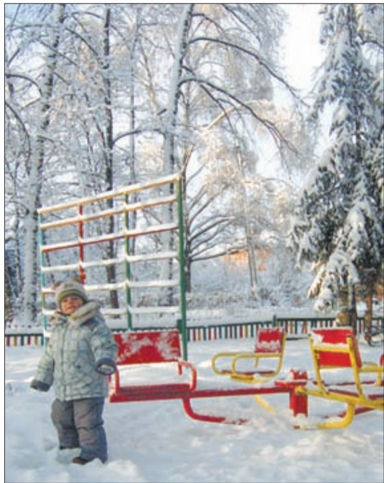
• Зимние развлечения способны не только создать радостное настроение у малыша, но и серьезно укрепить его здоровье.

До чего же хорошо в зимнем лесу! Пушистое белое одеяло укрыло озябшую землю, деревья и пни оделись в зимний сказочный наряд, а солнышко бриллиантами зажигает миллионы снежинок. Обычный день, но стоит войти в лес — и он становится праздничным! Легко дышится, впору запеть. Вот только желающим совершить пешую или лыжную прогулку по нашему лесу оказывается не так уж много, особенно в будние дни. А ведь зимняя прогулка вполне может заменить занятия в спортзале, лечебную процедуру или прием лекарств (особенно, если их не всегда удается получить в аптеках).