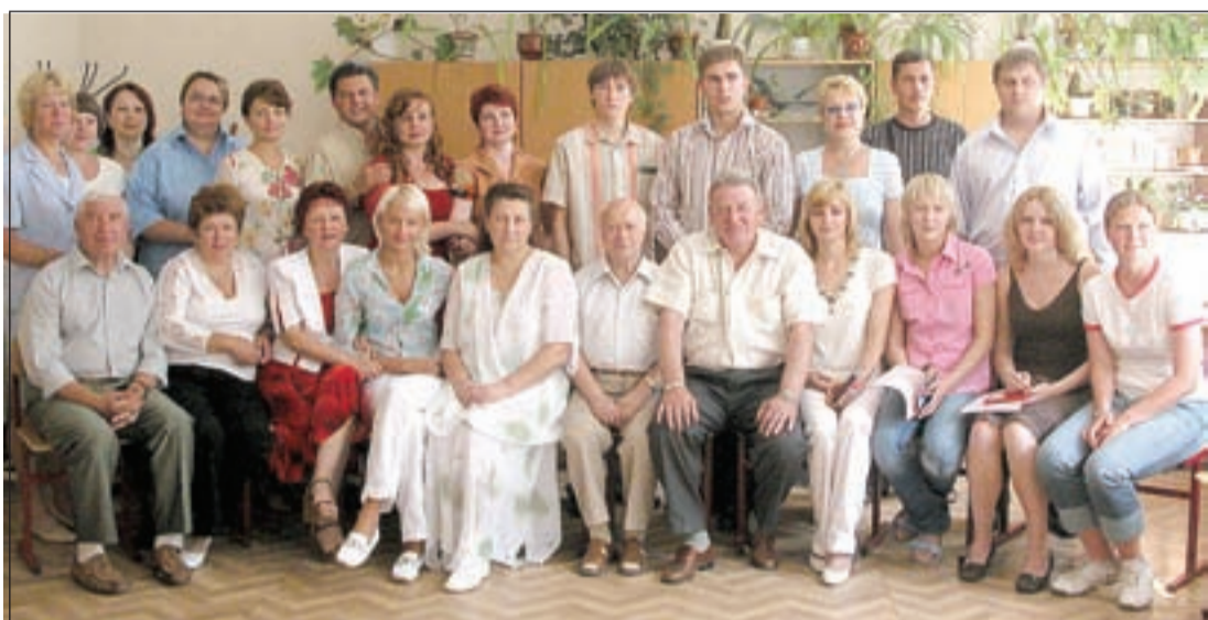
Общий снимок на память: учителя и ученики... Теперь они коллеги.

В последние дни июня в Одинцовском училище олимпийского резерва Московской области состоялся очередной выпуск.