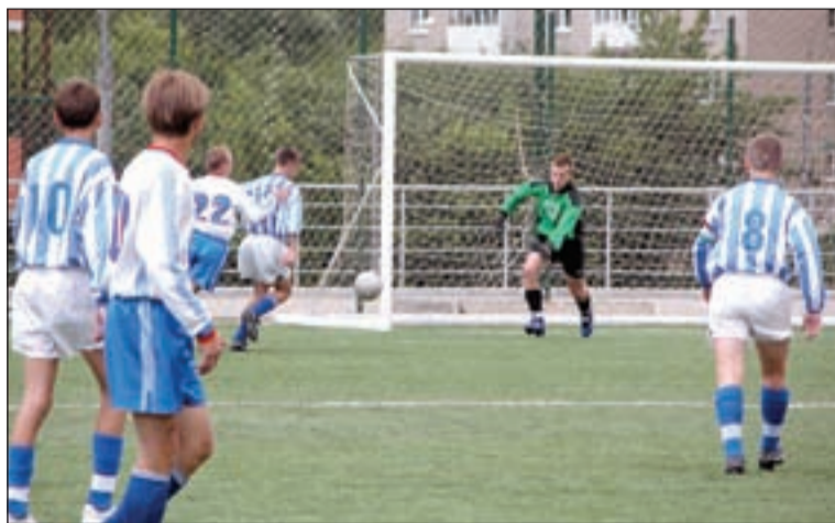
Ворота соперника атакуют одинцовцы 1990 года рождения.