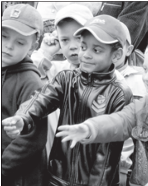
• Ну и что, что цвет кожи разный?!

— Вам не кажется, что вы сейчас рассказываете не о Москве, Подмосковье, а о Париже, который прошлой осенью сотрясали массовые молодежные бунты? Там ведь также все началось несколько лет назад: бедные рабочие пригороды и богатые центральные парижские кварталы. С каждым годом взаимное отчуждение и ненависть между этими двумя мирами нарастает, и вот достаточно малейшего толчка, чтобы улицы Парижа заполыхали под ботинками местных «скинхедов». Не ожидает ли вскоре то же самое Москву, а также ряд других российских городов?