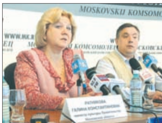
• Министр культуры правительства Московской области Галина Ратникова.