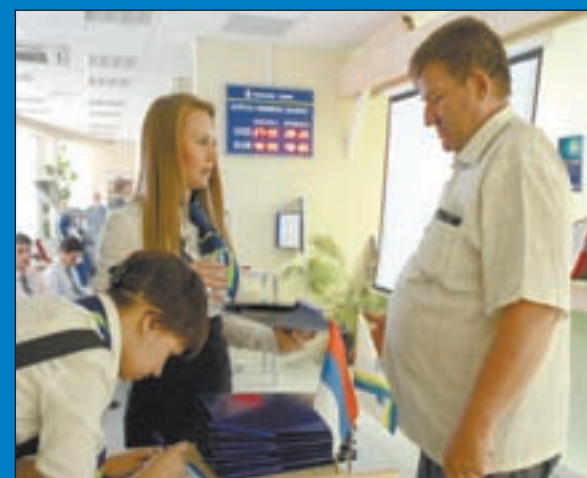
• Каждый предприниматель смог получить индивидуальную консультацию

По словам самих сотрудников УРАЛСИБА, польза от общения с клиентами на подобных семинарах обоюдная: клиенты получают ответы на интересующие их вопросы, а банк, в свою очередь, лучше узнает клиентов, их нужды и может отстраивать свой бизнес с учетом их запросов. Кстати, развитие продуктов с учетом интересов клиентов идет в банке непрерывно: в конце мая по всем кредитным продуктам для малого бизнеса УРАЛСИБ снизил процентные ставки.