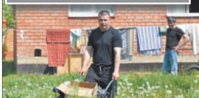
• Работа — лучшее лекарство.

Каждый, нуждающийся в помощи, может позвонить по телефону доверия центра организации «Преображение России»: 8-925-985-7777, или получить консультацию специалиста по вопросам реабилитации: 8(495)665-20-09.