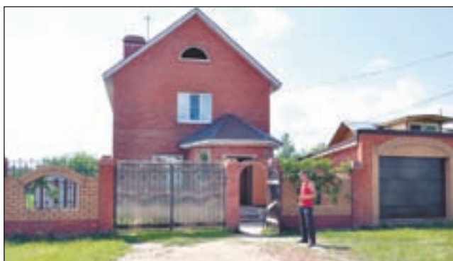
• В Ромашковском центре всегда помогут и поймут.

В целях недопущения пожаров, обо всех случаях пала просьба незамедлительно сообщать по телефону: 8 (495) 542-21-01 или 01.