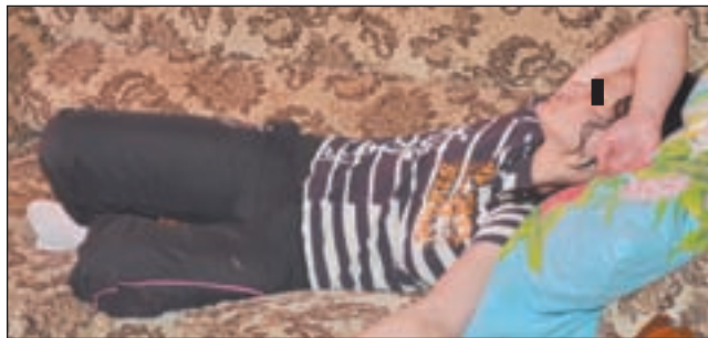
• Одна из новых клиенток центра.

— Я не приемлю медикаментозного лечения. Лично мне его хватало ровно чтобы дойти от клиники до дома. И всё начиналось заново. Главное — поставить себе установку и следовать ей до конца. Кроме того, мы стараемся полностью занять наших клиентов. Ведь центр находится на полном самообеспечении: сами оплачиваем аренду, сами покупаем всё необходимое. Поэтому берёмся за любую работу: занимаемся перевозками, сборкой и разбор-