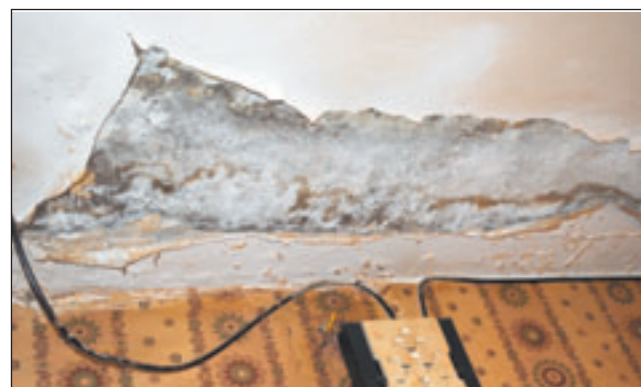
• Вот такой непрезентабельный потолок в квартире дома №11 по бульвару Любы Новоселовой.