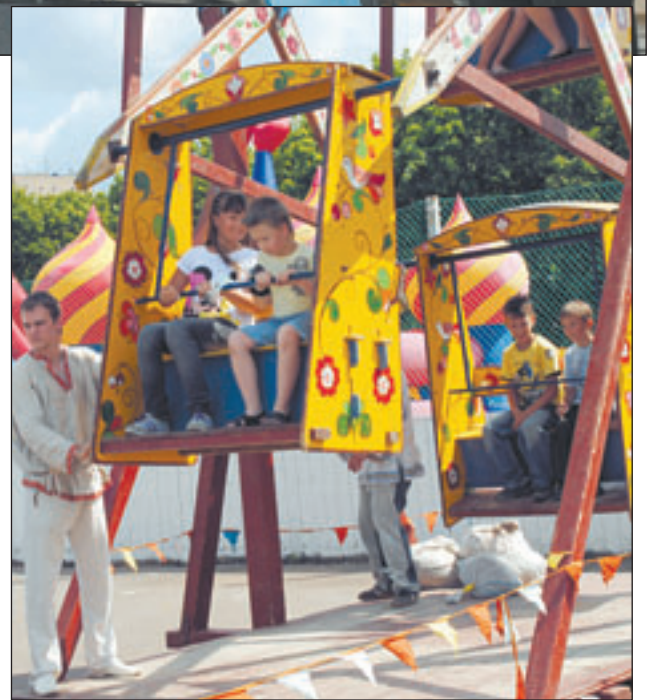
• Сложно было пройти мимо таких качелей-каруселей.