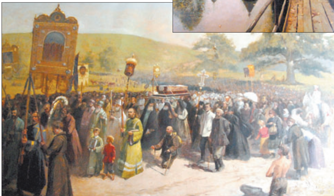
● Полотно А. Белоконного — «Перенос мощей Серафима Саровского».