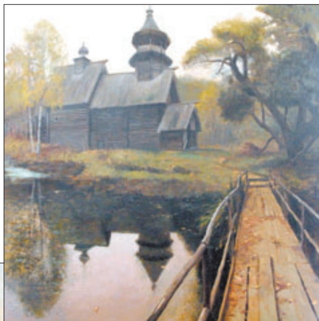
▼ Картина «Тишина».