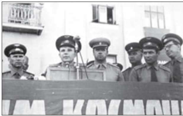
• 1962 год. Юрий Гагарин и Герман Титов выступают на митинге на полигоне Байконур.

подготовки данных, офицера направления оперативного управления Главного штаба, начальника оперативного отдела ГШ РВ, начальника центра оперативного-тактического исследования РВСН. Прошёл длинный военный путь от курсанта ВМФ до генерала Ракетных войск.