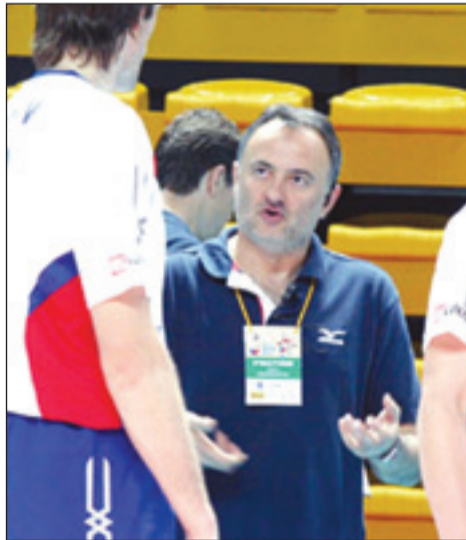
Сегодня тренер сборной России, серб Зоран Гайич «на коне»...