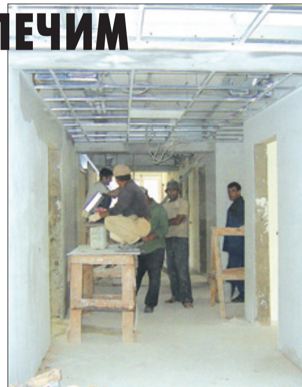
• ...И строители стараются.

лифты, идет замена оконных рам, дверей, полов, электрооборудования. Практически готовы к сдаче четыре палаты и буфет в кардиологическом отделении на 5-м этаже. Для обновленной ЦРБ уже выделены денежные средства на закупку мебели. Как только строители доложат о полной готовности больничных помещений, современные