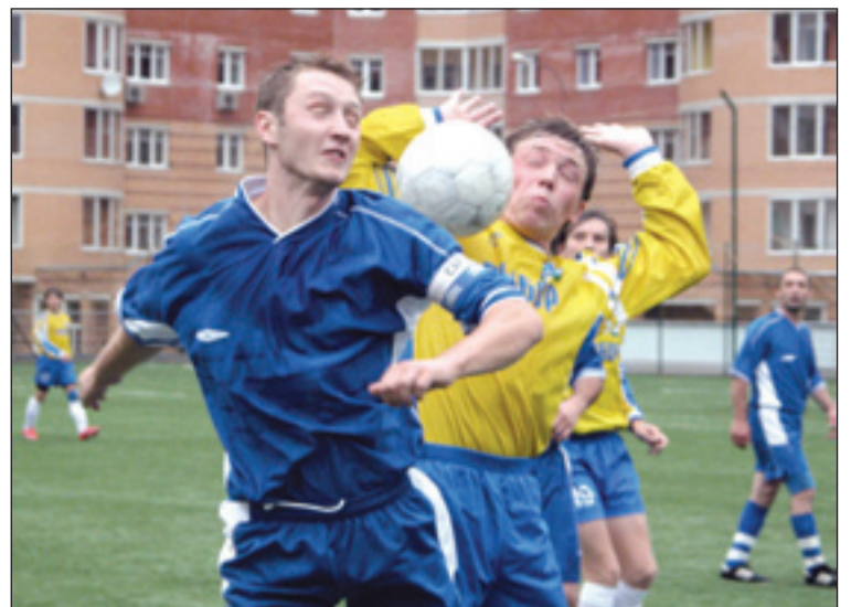
Микро-дуэль игроков «Кристалла» и «Выбора».

По ходу первого тайма игроки «Поддержки» несколько раз были грубо остановлены в