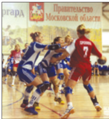
В красной форме атакует «Звезда».