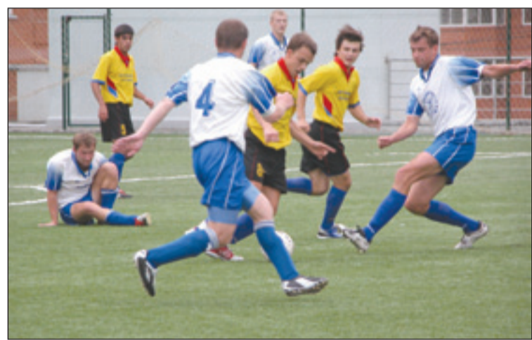
И хотя последние дни прохладны и сыроваты, на футбольном поле во время игры «Поддержки» со «Строймеханизацией №1» было жарко.