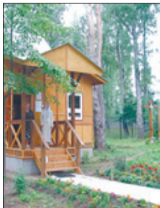
• Часовня св. Анастасии Нижегородской.

Первый в России и единственный в мире храм-часовня во имя святой Анастасии Нижегородской построен и освящен в Горках-10. Его возвели мастера «Товарищества реставраторов».