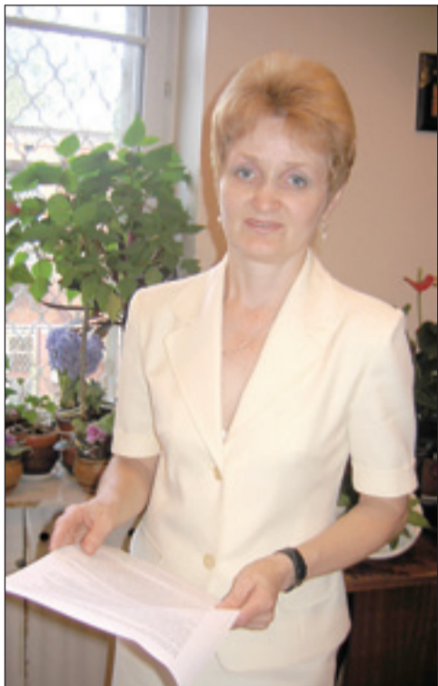
ского Союза, Российской Федерации, ветераны, депутаты Государственной Думы, налог уменьшили на 30 рублей? Но ведь раньше они его совсем не платили.

— Означает ли это, что таким заслуженным людям, как Герои Совет-