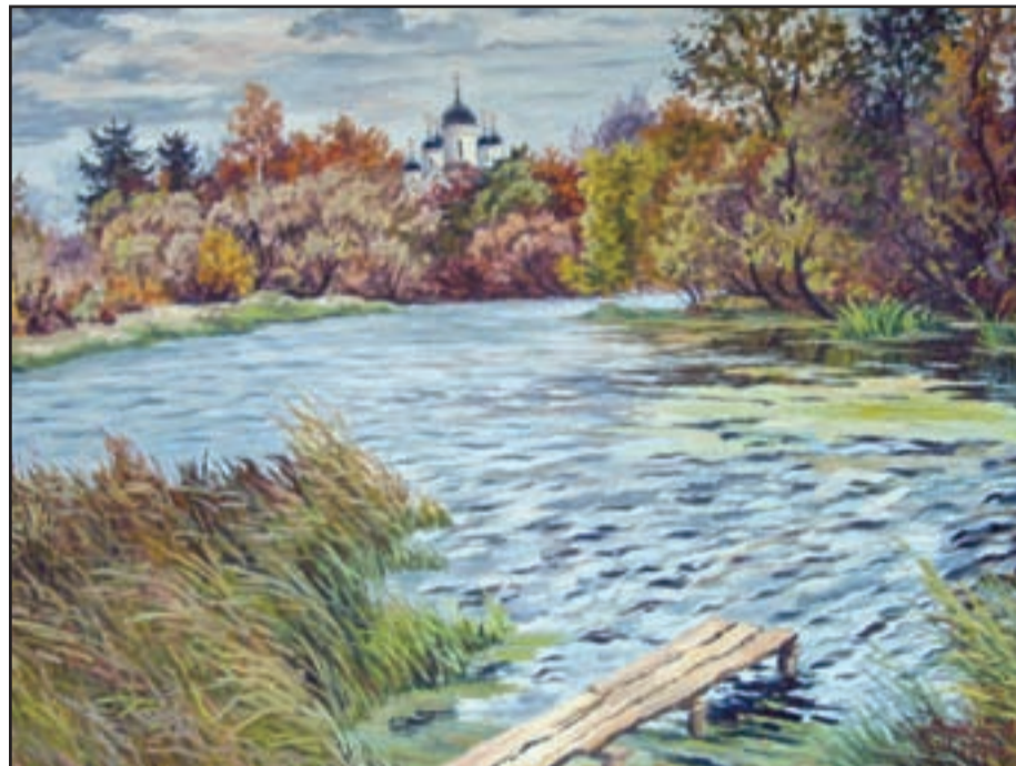
Картина Александра МУЦКОГО из пос. Горки-10

Клен напомнил о том, что спешит к дому осень, Знать не хочет она — рады ей или нет. Как всегда, ни о чем гостя даже не спросит, Лишь дождем за окном скажет тихо — «привет». Может ветреной быть она и молчаливой, Нам понять не дано ее душу и нрав, Но порою она может быть так красива — В позолоте лесов, в ярком бархате трав. Так устроена жизнь — все в природе бывает, За разлукой — любовь, за теплом — холода. Осень желтой листвой нашу грусть засыпает, Чтобы радости свет не угас никогда.