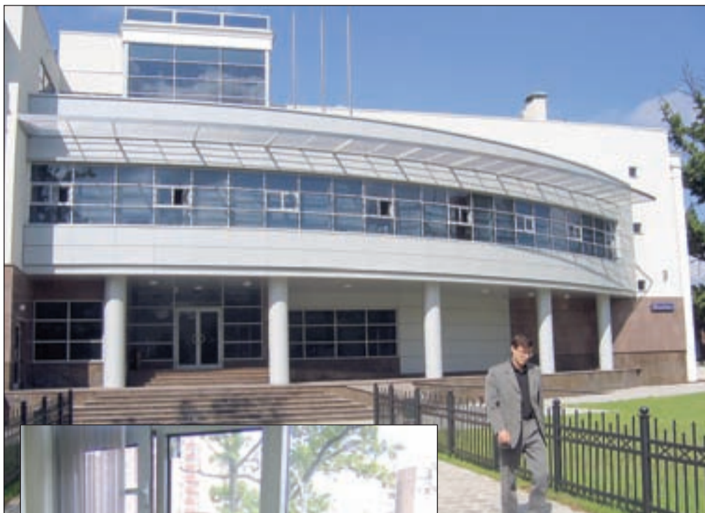
• Здание прокуратуры.