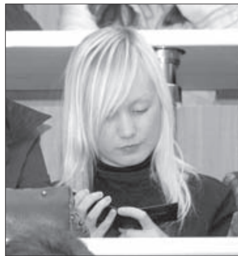
• «Вот ты какой, студенческий билет...»

открыто семь специальностей, то на следующий год будет девять. Расширяется учебная база; благодаря администрации района мы оснащены самым современным оборудованием, в наличии восемь компьютерных классов с лучшими профессиональными лицензированными программами, лингафонные кабинеты, Интернет-кафе, библиотека, кабинеты по психологии, криминалистике, спортивные залы, открытые площадки и многое другое. Именно этим современный вуз отличается от иных заведений с образовательными программами. Как в области изучения иностранных языков, так и в области компьютерной грамотности мы во много раз превышаем государственный стандарт (норматив) часовой нагрузки. Надеемся, что наши выпускники смогут свободно общаться и работать в любой точке страны и земного шара, так как стандарты обучения в Одинцовском гуманитарном университете соответствуют среднеевропейским стандартам, а в чем-то их превышают.