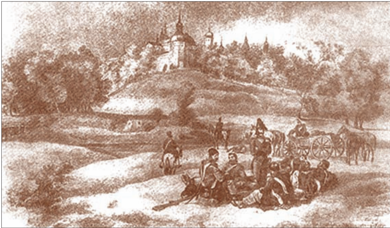
• Французы в окрестностях Звенигорода. Литография Альберта Адама.

«...отряд его (Винценгероде), подкрепленный одним егерским полком и шестью конными орудиями, получил назначение как можно скорее занять Звенигород и затруднить по дороге от этого города к Москве те войска, которые будут направлены по этому тракту от неприятеля. Винценгероде, в сопровождении моем опять поскакал (от Кутузова из Можайска 27 августа) ... к отряду, и на пути