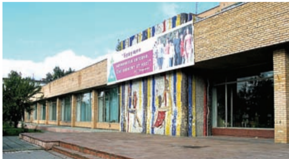
День открытых дверей в Одинцовском центре эстетического воспитания пройдет 18 сентября. Начало в 18.30.