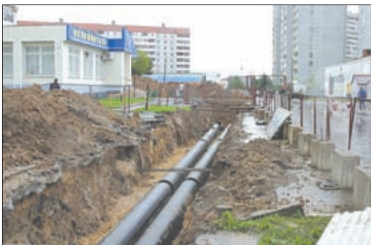
• В 5-м микрорайоне Одинцова работы по замене теплотрассы в самом разгаре даже в сентябре.

— По городу Одинцово котельные подготовлены полностью: уже сданы. По жилому фонду паспорта готовности еще не сданы, но должны быть готовы до 15 сентября — в процессе заполнения системы. Так что, в принципе, особых беспокойств и опасений на предмет того, что мы «войдем в зиму» плохо подготовленными к ней, состояние наших теплокоммуникаций не вызывает. Мало того, в текущем году нам удалось добиться выделения по областной программе 30 миллионов рублей (для сравнения, в прошлом году нам было выделено 9 миллионов), которые мы смогли «разбросать» по МРЭПам района. С 1 сентября мы начали объезд предприятий с