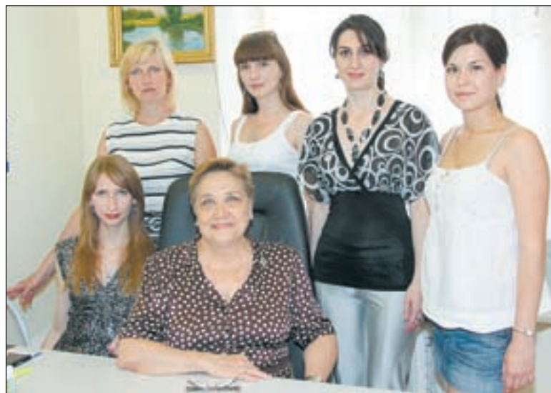
• В ПКЦ работают профессионалы, владеющие инновационными современными технологиями в лечении детей, подростков, женского и мужского населения с репродуктивными проблемами.

В настоящее время всё очевиднее, что снижению репродуктивного потенциала населения способствует не только наличие медицинских причин. Значительный вклад в данную проблему вносят ситуации психологической напряженности и затяжного хронического стресса, ведущие к различным психическим отклонениям и дезадаптации, а также широ-