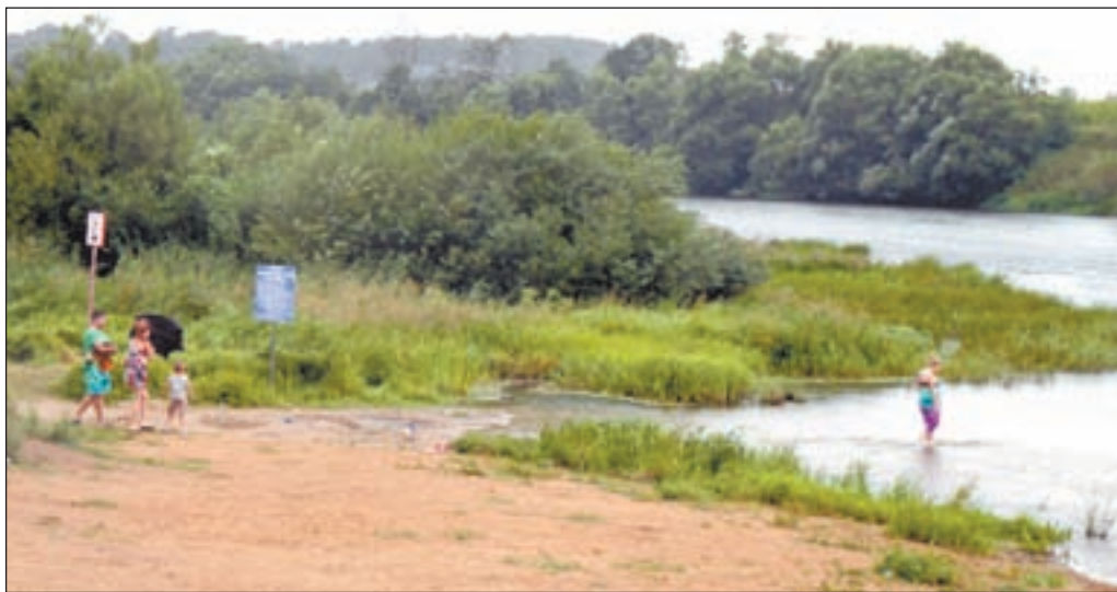
▲ Именно здесь бдительные отдыхающие увидели в воде масляное пятно.

Мужчины не предполагали, что в этом месте протекает родник, который и вынес солярку в реку. Когда один из рабочих возвращался назад, его задержали с поличным (с пустым ведром из-под