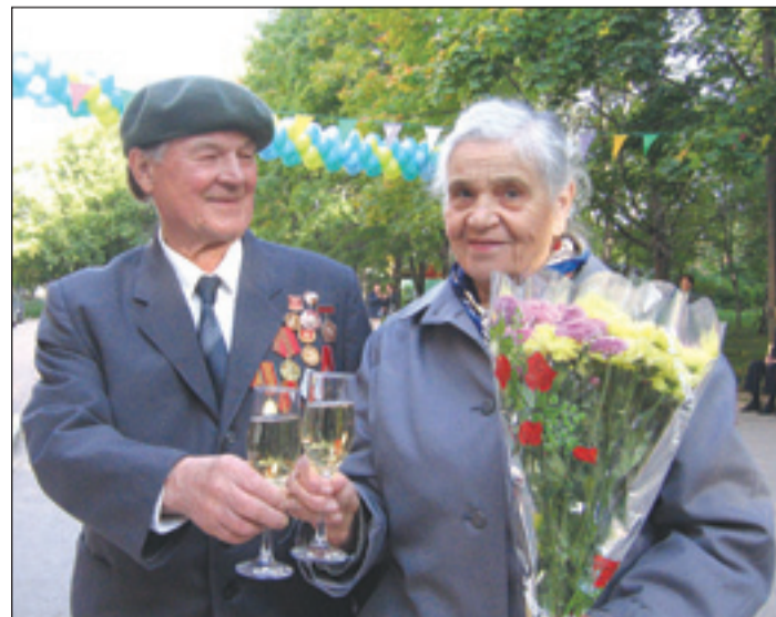
• Супруги Грибовы — 50 лет вместе!