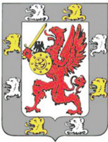
• Герб дома Романовых

В отличие от отца второй русский царь династии Романовых уделял Звенигороду