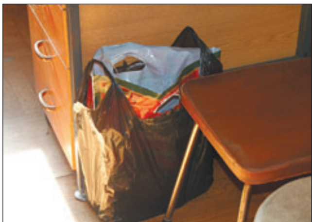
• Вот этот подозрительный предмет.

С приездом кинолога наступила финальная часть учений. После того, как собака обследовала пакет и дала понять, что опасности он не представляет, сотрудник кинологической службы доложила результаты осмотра руководству. Затем прозвучала команда сворачивать оцепление. Далее последовало подведение итогов.