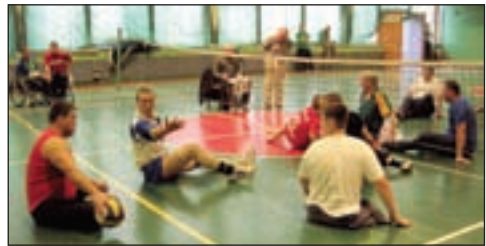
• Такой вот волейбол, и наши в нем сильны!

ДЮСШ по бадминтону объявляет набор учащихся на 2006-2007 учебный год. Справки по тел.: 596-30-98, 599-84-31