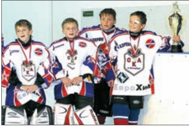
• Кубок Третьяка — у питерского СКА.

С 31 августа по 3 сентября в Муниципальном детском центре хоккея и фигурного катания прошел уже четвертый турнир по хоккею на Кубок Владислава Третьяка среди ребят 1992-1993 годов рождения.