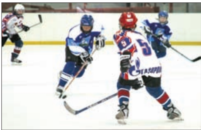
• Игровой момент финала: в атаке — одинцовцы.

ПО ТРАДИЦИИ в нем, кроме нашей команды «Одинцово», приняли участие белорусский «Химик» из Новополоцка и подольский «Витязь». Новичком турнира стала довольно сильная команда СКА из Санкт-Петербурга. В этом году Владислав Третьяк не смог лично приехать на открытие — слишком много забот у него было накануне старта очередного сезона в хоккейной суперлиге. Напомним для далеких от спорта, что Владислав Третьяк теперь не только депутат Госдумы, но и президент хоккейной Федерации России.