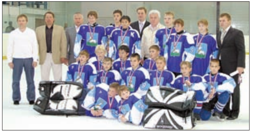
• Снимок на память с главой района — утешительный приз для одинцовских мальчишек.

Приятно, что не испортили эту игру своим судейством и арбитры. Да, мы проиграли, но по делу и с достоинством. Игра получилась. У двух других оппонентов по турниру мы выиграли: у «Химика» со счетом 3:1, у «Витязя» — 4:1.