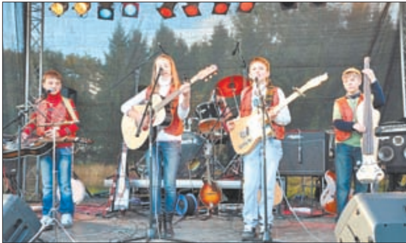
• Юные дарования — обнинская группа «Веселый дилижанс».

Затем ведущий представляет коллектив «Веселый дилижанс» (Обнинск). При этом зачитывает историю группы, чем вызывает интерес и легкое недоумение у зрителей. Оказывается, это уже третье поколение молодых музыкантов. Первый состав был номинирован на премию «ГРЭММИ» в 2003 году, но в 2006 году прекратил свое существование. Современный же состав образовался в 2008 году и в настоящее время имеет солид-