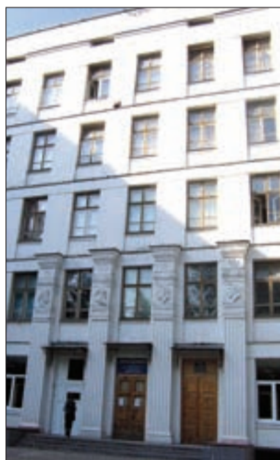
• «Нетиповое» здание лицей-миллионера.