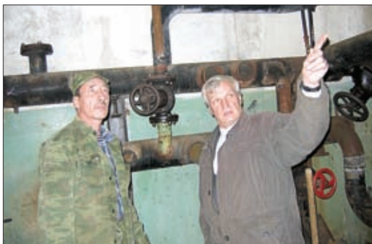
• На ЦТП идет установка дополнительного оборудования.

По Петровскому шоссе мы пересекаем железную дорогу и попадаем в южную часть Голицына. Жилой микрорайон ДРСУ-19 отапливает одна ко-