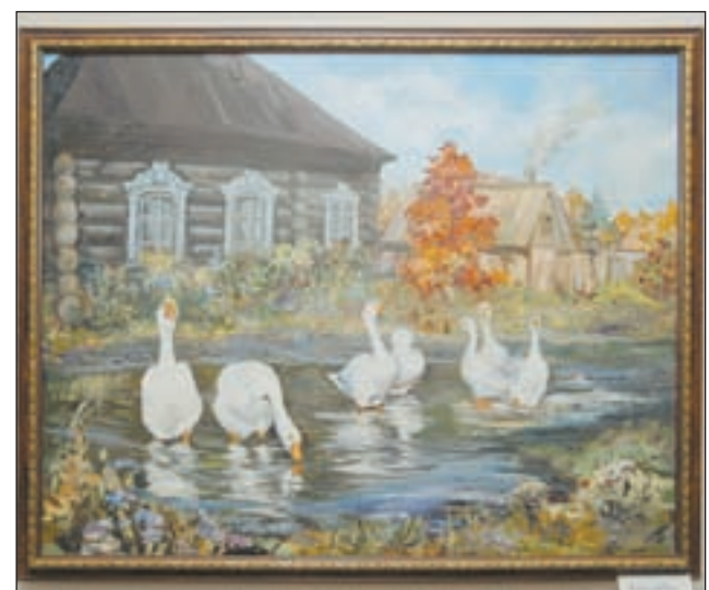
• «Жили у бабуси...»: обворожителен колорит русской деревни.