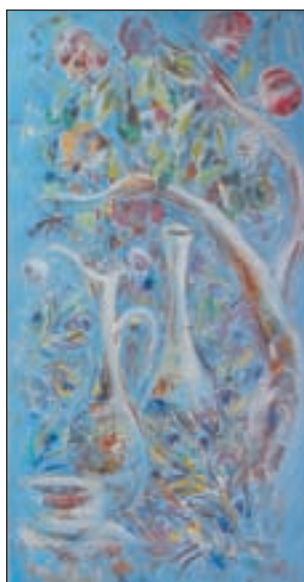
• Фрагмент триптиха «Серенада голубому небу».