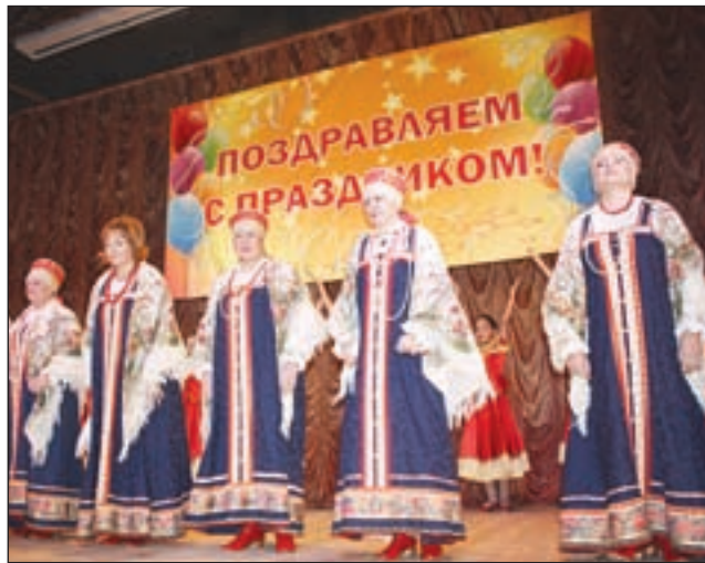
• На сцене — ансамбль «Белые росы».