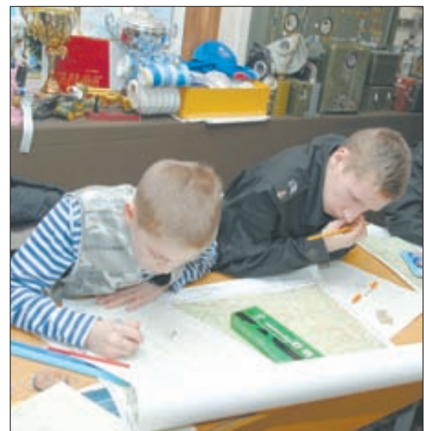
• Ребята готовят карту весеннего похода.