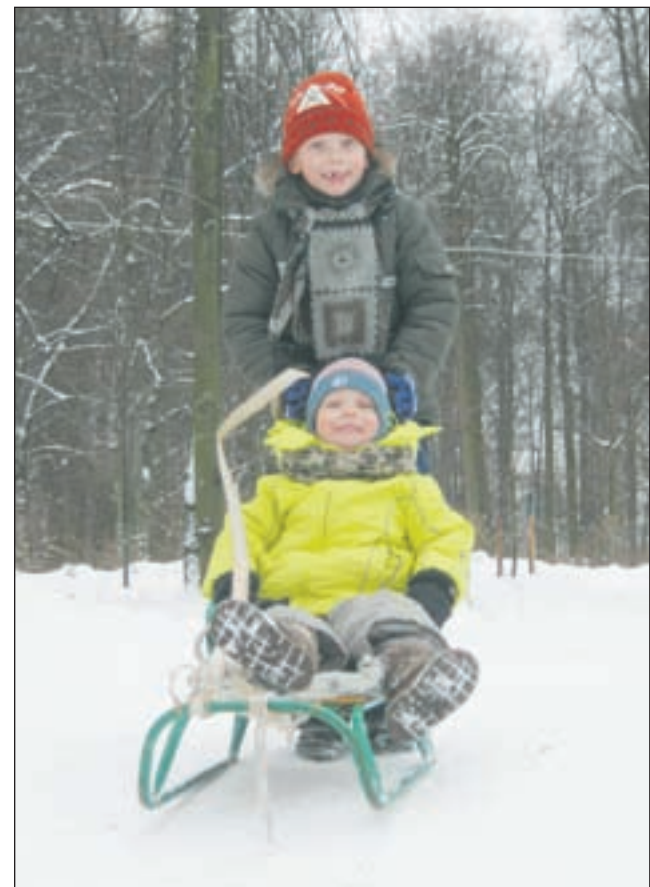
• В живописном парке музея можно отлично отдохнуть.

Беседу вела Лариса РОДИОНОВА.