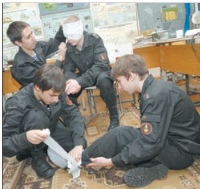
• Перевязать раненого бойца надо быстро и умело.