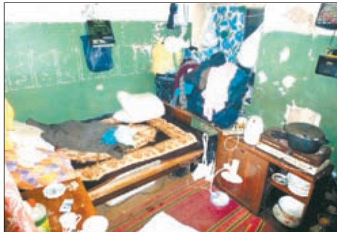
• «Незатейливый» быт незаконных мигрантов.

в новостройке на улице Садовой. Ни один из задержанных не имел при себе соответствующих документов.