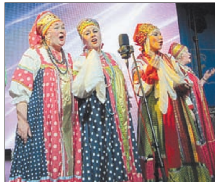
• В числе лидеров конкурса — хор народной песни «Родник».