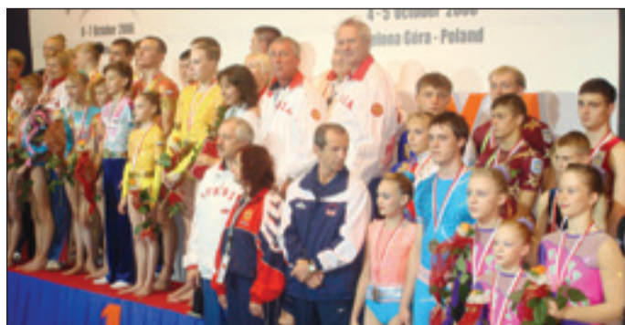
• Триумф российских акробатов.

11 — 15 октября в польском городе Зелёна Гура проходил командный чемпионат Европы по акробатике. Соревновались мужчины, женщины в различных возрастных категориях и юниоры.