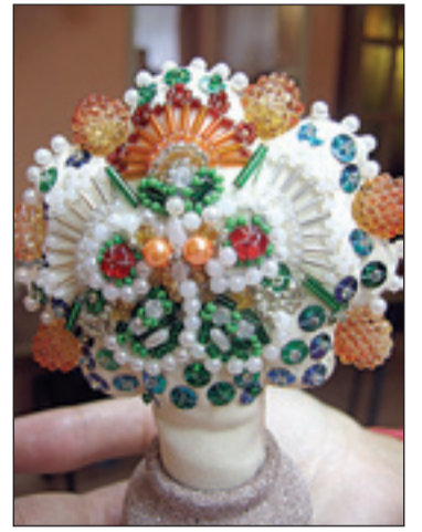
• И вот такую красоту создают в «Калинке».

Что еще? Как уже сообщали «Новые рубежи», 9 мая нами и студией звукозаписи «Гигант-Рекорд» был выпущен диск «За любимую Родину!», пос-