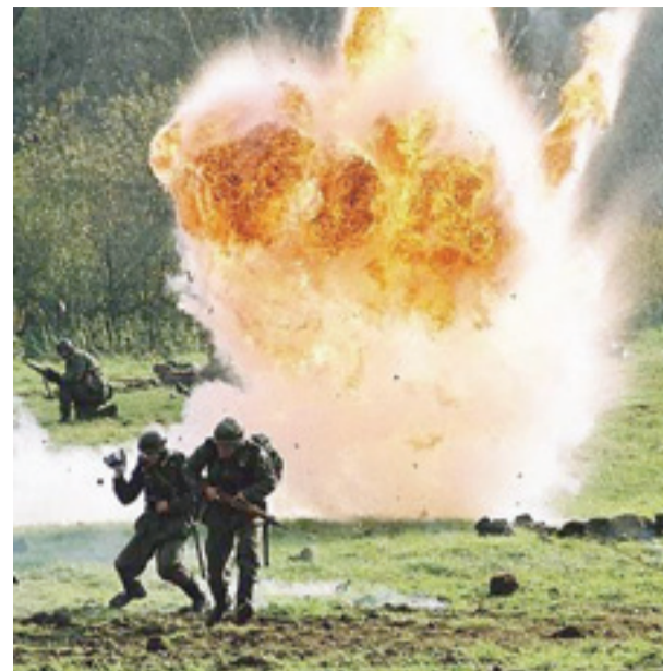
Но не устояли под ударами советской артиллерии...

На территории Одиновского района нет клубов непосредственно реконструкторских по данному периоду отечественной истории, подобных московскому «Выстрелу». Зато есть очень близкие им по духу и задачам военно-исторические поисковые клубы, среди участников которых есть и настоящие реконструкторы, принимающие, кстати, участие и в работе «Выстрела».