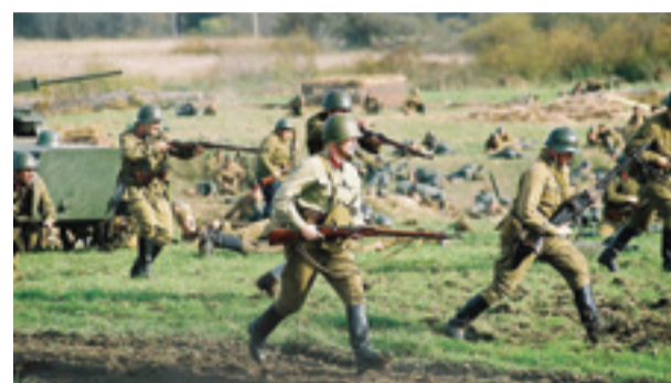
... и пехоты

Адреса и телефоны Одиновских военно-поисковых клубов: