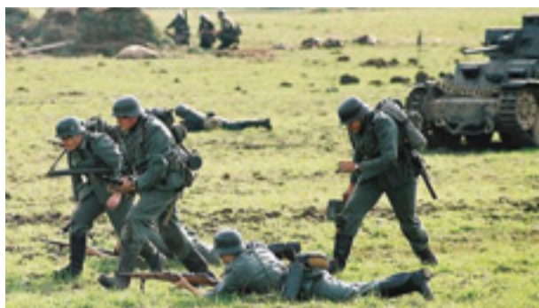
Силу немцы сосредоточили большую, и пешую...

Ежегодно, в течение семи последних лет, на Бородинском поле проводится реконструкция сражения немецко-фашистских войск и подразделений Красной армии. В гости к нашим соседям в Можайский район, где расположено Бородинское поле, в очередной раз отправилась и команда одиновцев. Причем не только в качестве зрителей реконструированного сражения, но и непосредственных участников – «наши» воевали на стороне Красной армии. Стать участником реконструкции непросто, надо пройти определенную подготовку в военно-историческом клубе и подготовить обмундирование и снаряжение, в мельчайших деталях соответствующее историческим образцам. Репортаж о сражении «Москва за нами!», посвященном 65-летию битвы под Москвой, ведет Иван Хиблин.