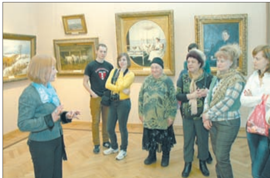
• В Губернаторском доме.