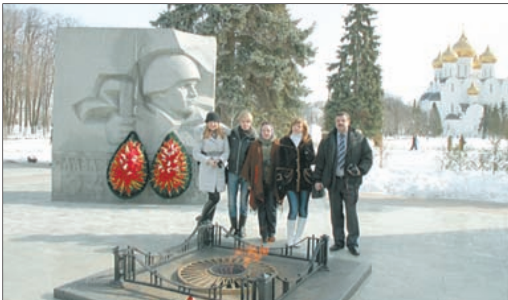
• У мемориала Славы.