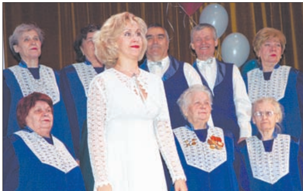
• Выступает одинцовский хор ветеранов «Лира».