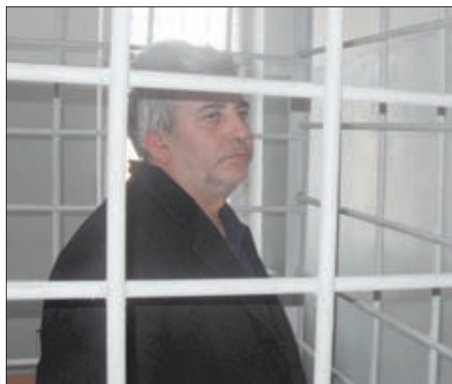
• Заказчик похищения.

НАЧАЛОСЬ всё 16 января. В половине седьмого вечера директор одного из заводов города Голицыно, сев в служебный автомобиль, спокойно поехал домой в посёлок Летний Отдых. Кроме него в машине находились его сын и водитель. Но через некоторое время служебный автомобиль блокировали две легковые машины. Одна остановилась перед ним, другая — позади. Из машин выскочили неизвестные люди и направились к заблокированному транспорту. Угрожая руководителю предприятия оружием, злоумышленники выволокли его из служебной машины и пересадили в один из своих автомобилей. Затем бандиты переехали на улицу Гоголя поселка Летний Отдых. Там они, угрожая похищенному, потребовали у него несколько миллионов рублей за освобождение. Причем требовали сразу всю сумму наличными. В это время один из преступников удерживал в служебном автомобиле сына директора и водителя в качестве заложников. К счастью, директору завода удалось убедить похитителей, что собрать требуемую сумму в такой короткий срок нереально. В итоге, он вместе с одним из преступников пошёл домой и передал ему