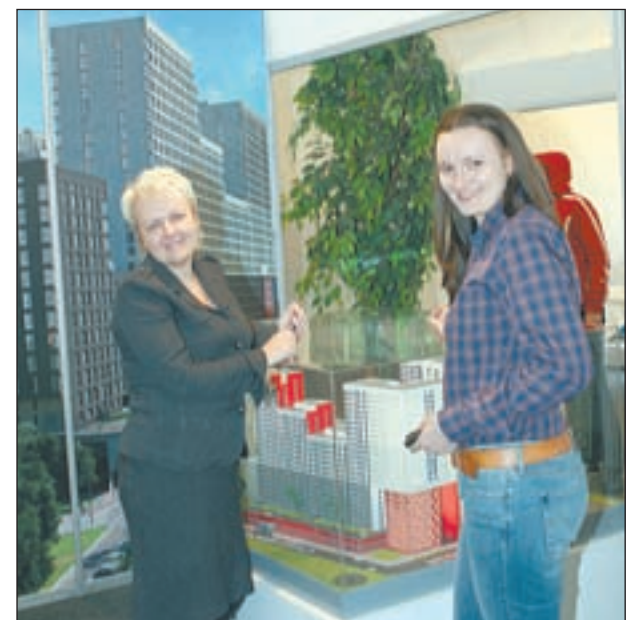
• Представители компании «Текта» — одного из крупнейших застройщиков московского региона.

проведением сделок, Эстейт», ООО «Текта», ООО «Компания «Строй-Сити», ООО «АН ОдиАН», Офис «МИ-ЭЛЬ-Одинцово», ООО «Ч2К Сервис Персонал», но и получить адреса профессионалов, умеющих решать их лучше других. Наталья ИГУМНОВА. Фото автора.