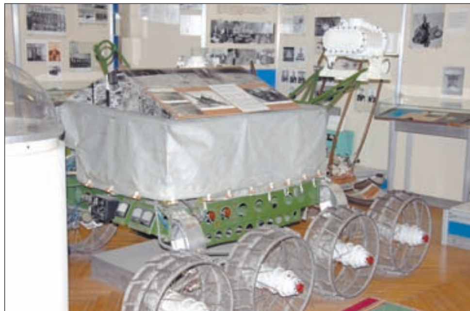
• «Двойник» лунохода.

ники имени В.П. Глушко в Санкт-Петербурге. Наш экспонат на орбите не был, но тем не менее к нему всегда проявляется повышенный интерес.