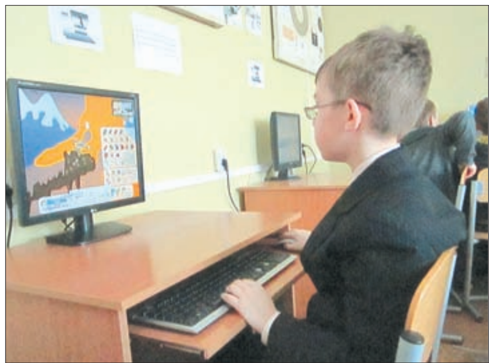
• В увлекательном мире информатики захаровские школьники как дома.