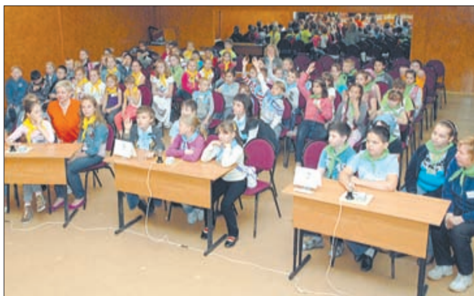
• Здесь проводятся семинары в занимательной форме.

— Скоро будет экскурсия на Бородинскую панораму. Я считаю, очень важно воспитывать