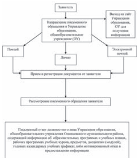
Приложение №1 к Административному регламенту предоставления муниципальной услуги по предоставлению информации об образовательных программах и учебных планах, рабочих программах учебных курсов, предметов, дисциплин (модулей), годовых календарных учебных графиках