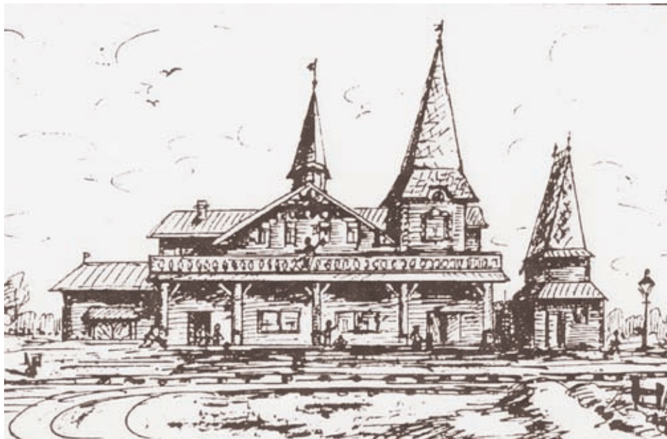
• Железнодорожный вокзал в Одинцове. Построен в 1870 году из дерева.