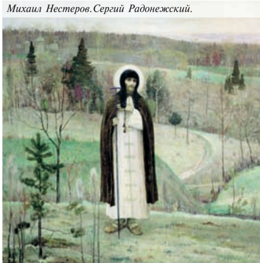
Михаил Нестеров. Сергий Радонежский.