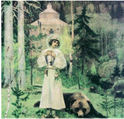
Михаил Нестеров. Юность преподобного Сергия Радонежского