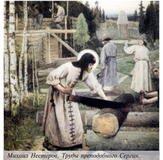
Михаил Нестеров. Труды преподобного Сергия.