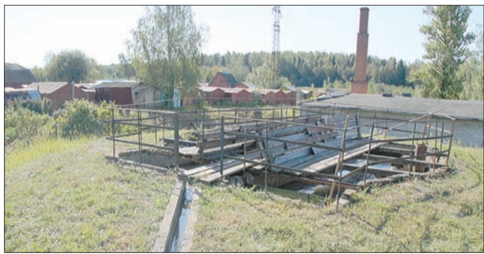
• Глядя на эту насосную станцию, вспоминается классик: «Ты жива ещё, моя старушка?».