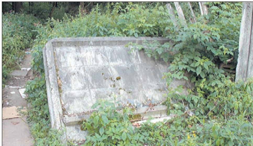
• Завалившиеся заборы сегодня — «визитная карточка» многих военных городков.

К слову, здесь же нам выпало «счастье» лицезреть брошенную рядом с одним из домов «шишигу». Сразу оговорюсь, к военной прокуратуре тут вопросов не было. Поскольку, судя по номерам, ГАЗ-66 являлся гражданским автомобилем (видимо, кто-то купил «вояку», а потом поставил на длительную консервацию), вопрос его устранения с придомо-