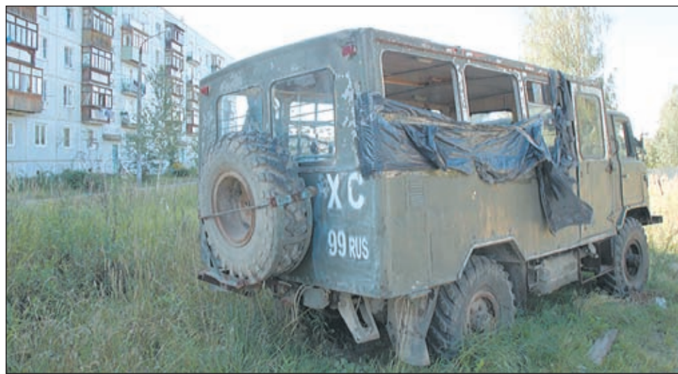
• «Гвоздь» придомового интерьера — законсервированная «шишига».