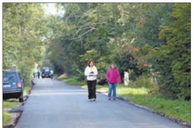
• 2-я Советская улица в Жаворонках избавилась от выбоин.

Татьяна БУРЯКОВА.