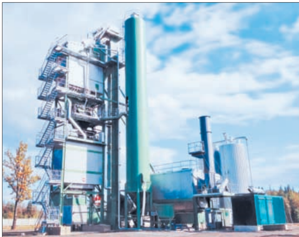
• Строящийся в Часцах асфальтобетонный завод.