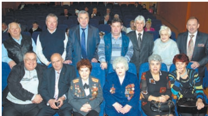
• Ветераны-милиционеры — как одна дружная семья.

В этот день в адрес виновников торжества звучало немало замечательных слов. Директор