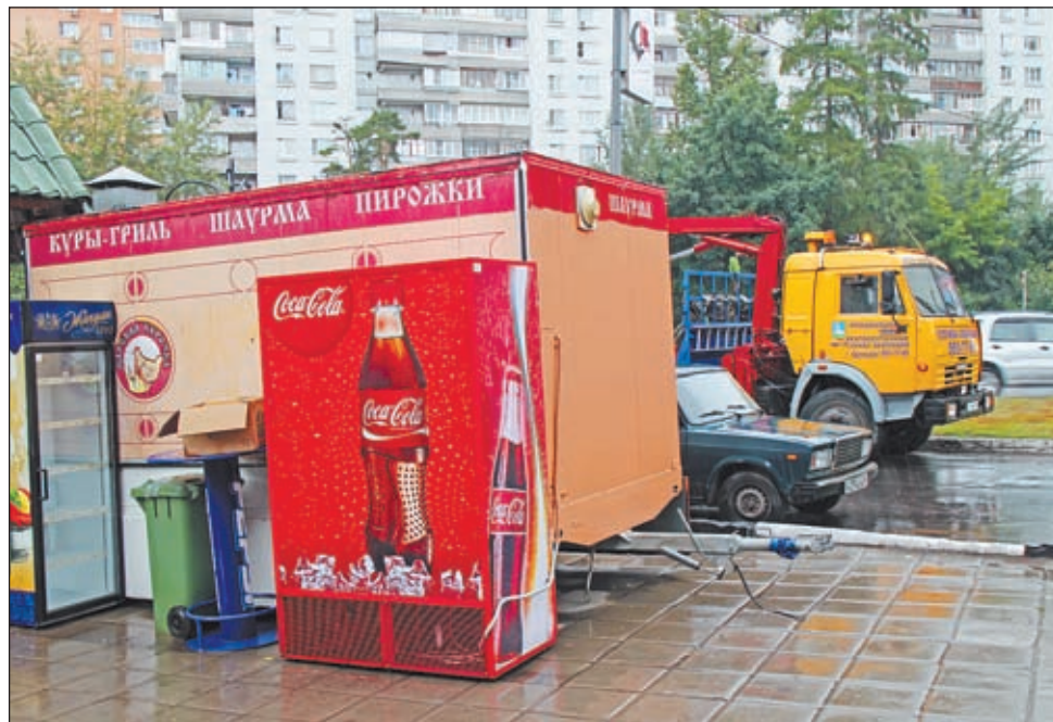
• С такими объектами торговли городские власти больше не церемонятся.

ПРЕДМЕТАМИ внимания сотрудников отдела по развитию малого и среднего предпринимательства, торговли и сферы услуг администрации городского поселения Одинцово на этот раз стали палатки близ дома №62 по улице Чистяковой и дома №21 по улице Кутузовской. Стоит заметить, что за несколько дней до рейда владельцы незаконно установленных павильонов были заочно оповещены администрацией о необходимости убрать с улиц города своё имущество. Заочно, потому что (и это характерно) в большинстве своём хитрые палаточники так и остаются неизвестными. Объявление с вышеназванными