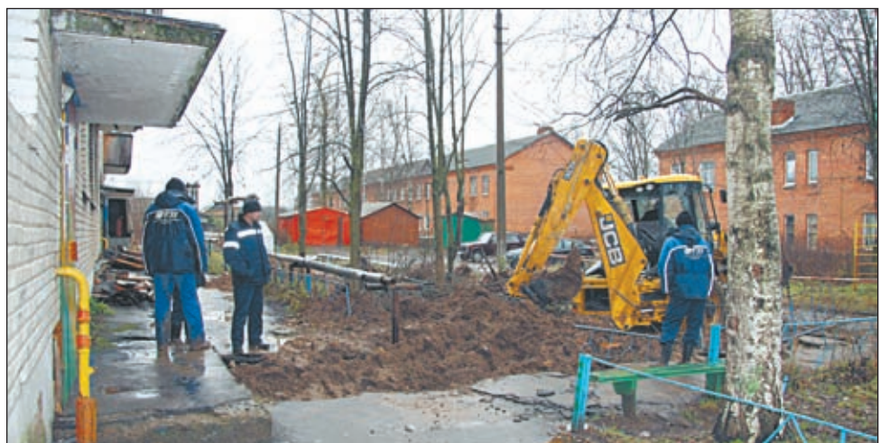
• Мешают отопительному сезону в Покровском и постоянные прорывы теплотрасс.