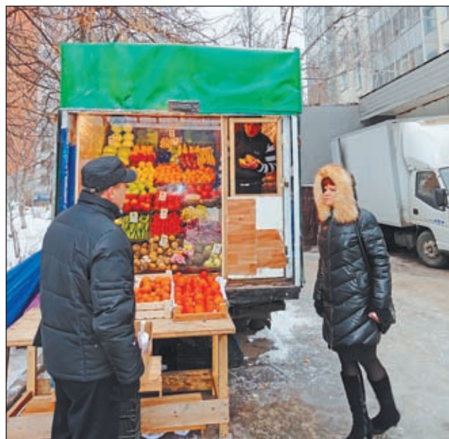
• Эту палатку обязаны были закрыть более двух месяцев назад...

Итак, за рыбным прилавком — колоритная черноглазая дама с экзотическим именем и широкой улыбкой. Напротив — двое весёлых парней торгуют плодово-овощной продукцией. Хозяин у этих двух точек — один, но никто из участников рейда так достоверно и не выяснил, кто он. Лоток с овощами к холодам самовольно утеплили, преобразовав его в тоннарик с застеклённой витриной. Разрешение на торговлю овощами и