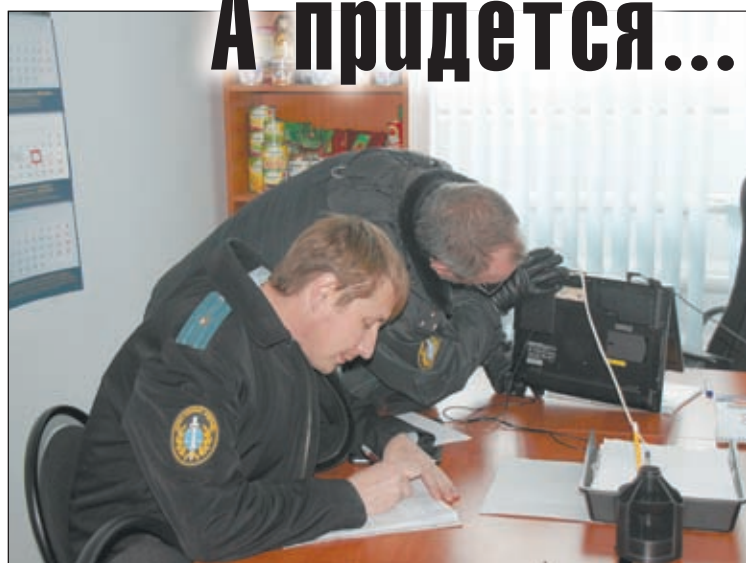
• Судебные приставы арестовывают имущество фирмы-должника.

Так что руководство фирмы обязывалось в установленном законом порядке долг оплатить.