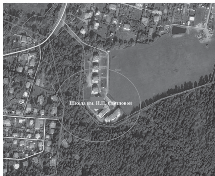
Схема границ прилегающей территории Школы им. И.П. Светловой, на которой не допускается розничная продажа алкогольной продукции

Главный редактор Нина ДЬЯЧКОВА Директор по рекламе Алена ПАТРИНА Вёрстка: Мария МАРКОВА Екатерина КОЧЕВАЛИНА Екатерина БАШКАТОВА Редактор-корректор Тамара СЕМЕНОВА Корректоры: Талия КИМ Анна ОРЛОВА