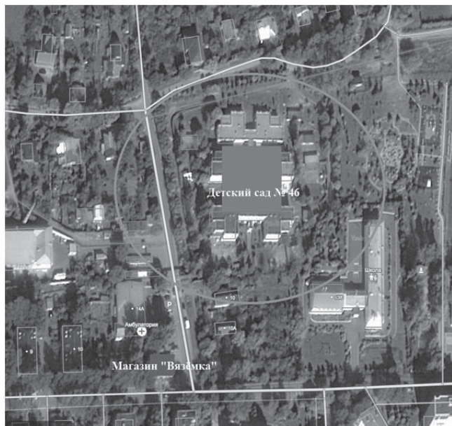
Схема границ прилегающей территории МБДОУ Центр развития ребенка - Детский сад № 46, на которой не допускается розничная продажа алкогольной продукции

Приложение 3 к постановлению Администрации сельского поселения Назарьевское Одинцовского муниципального района Московской области № 02 от 25.01.2016