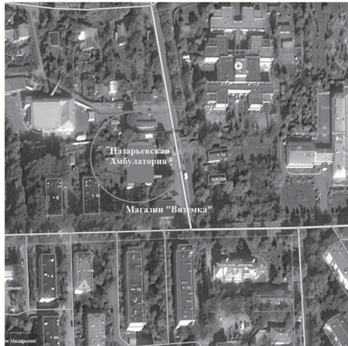
Приложение 7 к постановлению Администрации сельского поселения Назарьевское Одинцовского муниципального района Московской области № 02 от 25.01.2016

Схема границ прилегающей территории Назарьевская амбулатория МУЗ «Районная больница № 2», на которой не допускается розничная продажа алкогольной продукции