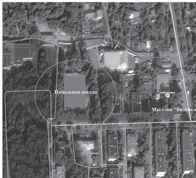
Схема границ прилегающей территории МБОУ Назарьевская СОШ (начальная школа), на которой не допускается розничная продажа алкогольной продукции

Приложение 3 к постановлению Администрации сельского поселения Назарьевское Одинцовского муниципального района Московской области № 02 от 25.01.2016