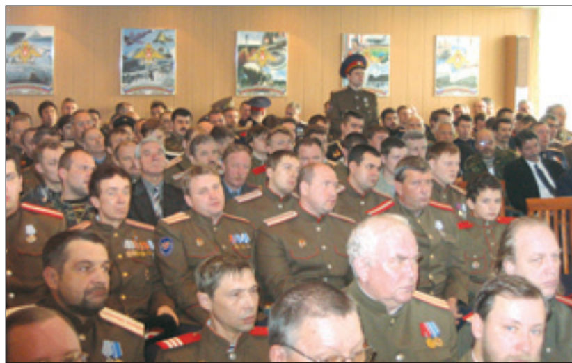
• Казакам было что обсудить и о чём задуматься.

В Одинцове прошёл Большой казачий круг Московского областного отдельского казачьего общества.