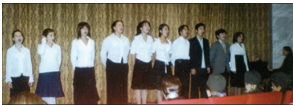
• Вокальная группа Одинцовского центра эстетического воспитания.