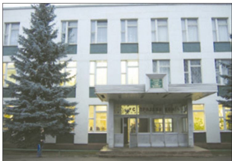
• Любимых окон негасимый свет.

ЭТА в общем-то еще молодая школа по праву является одной из лучших в Одинцовском районе. За три десятилетия она дала путевку в жизнь более 1400 учащимся, 15 ее выпускников — золотые и серебряные медалисты.