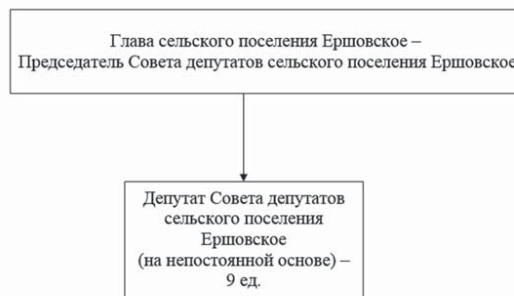
СХЕМА СТРУКТУРЫ Совета депутатов сельского поселения Ершовское Одинцовского муниципального района Московской области по состоянию на 1 января 2018 года

Приложение № 2 Утверждена решением Совета депутатов сельского поселения Ершовское от 27.12.2017 № 6/56