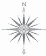
Чертёж межевания территории