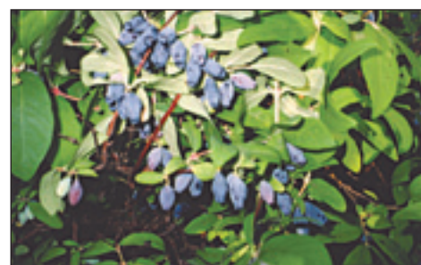
• Жимолость синяя — ценный ранний медонос. Растет довольно медленно, но образует плотные кусты. Морозостойка, теневынослива, чувствительна к засухе. Горьковатые ягоды созревают в конце июня — начале июля, целебны.

Для посадки жимолости выбирают хорошо освещенное место (в тени плохо плодоносит), защищенное от северных ветров другими посадками или строениями. К почвам это растение не особо требовательно. Однако хороший рост и обильное плодоношение наблюдаются на богатых перегноем, рыхлых, хорошо увлажненных (но без застоя воды) участках. Если почва кислая, перед посадкой жимолости ее следует известковать. Луч-