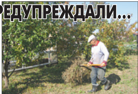
• Не стоит перенапрягаться ни с лопатой, ни с вилами!

Чтобы работа на дачном участке не нанесла вред вашему здоровью, прислушайтесь к следующим советам.