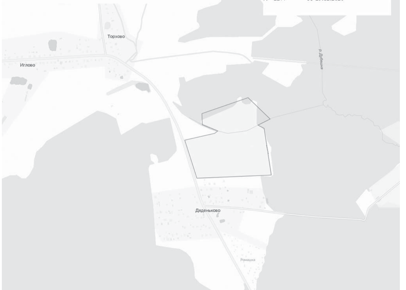
Схема расположения элемента планировочной сети с наименованием «территория «КП «Западная усадьба»