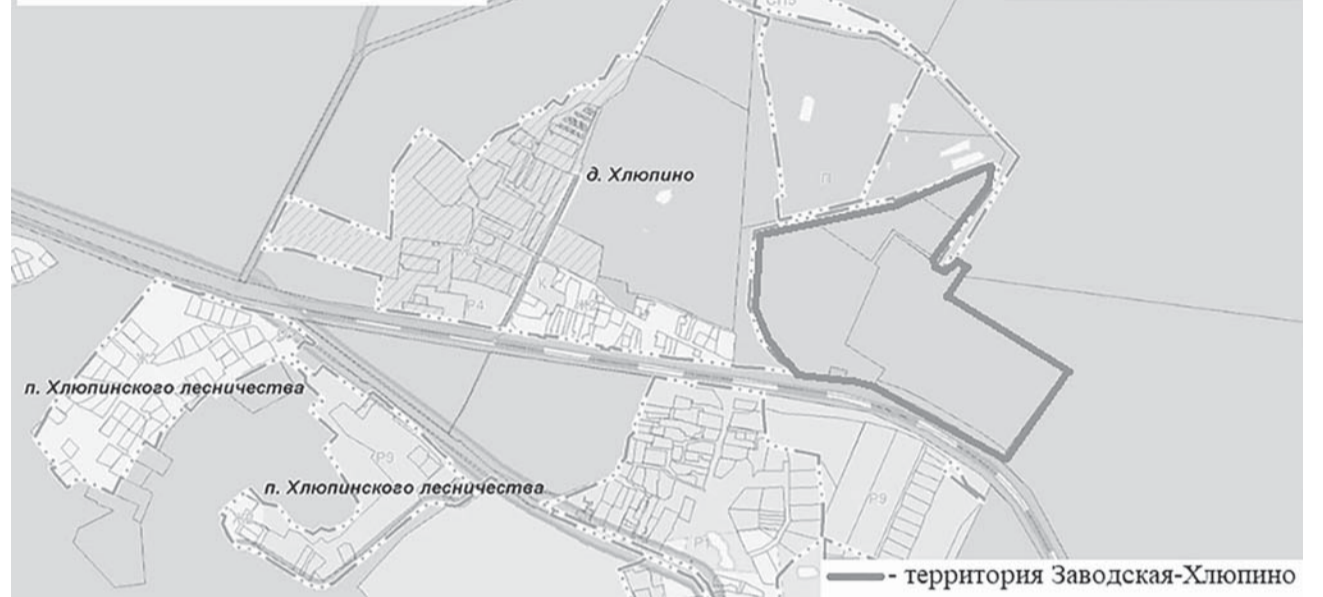
Схема расположения элемента планировочной структуры с наименованием "Заводская-Хлюпино"