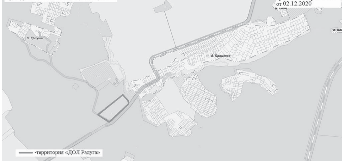
Схема расположения элемента планировочной структуры с наименованием «ДОЛ Радуга»

Приложение к решению о присвоении адреса №2081 от 02.12.2020