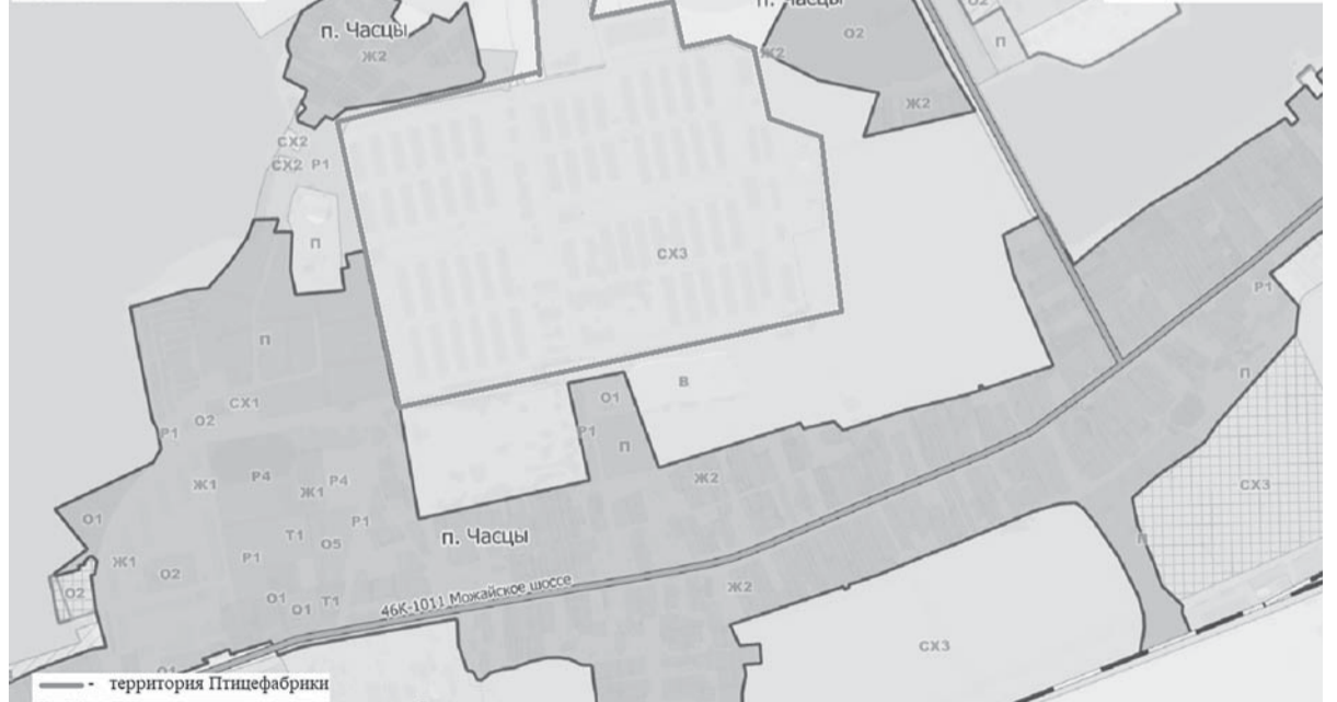
Приложение к решению о присвоении адреса № 37 от 14.01.2020