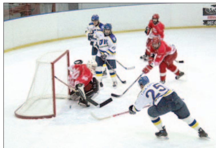
• Хоккеисты Одинцовского гуманитарного университета проводят в ворота столичного «Спартак» очередную шайбу.

Юные хоккеисты нашей школы хоккея имени Виктора Тихонова, как вы уже отметили, тоже радуют победами в различных турнирах. В связи с этим губернатором Московской области Б.В. Громовым было принято решение о создании на базе нашего Дворца