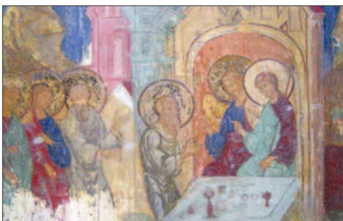
• Пострадавшие от влаги фрески.