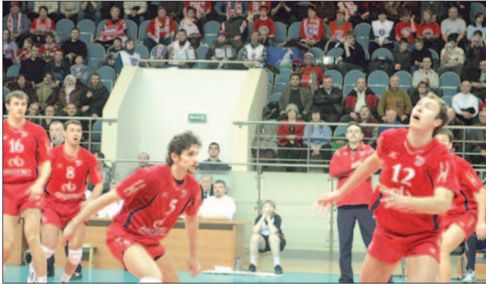
• Любимая команда, мы с тобой...

У наших волейбольных клубов: мужского «Искра» и женского «Заречье-Одинцово» самая преданная болельщицкая «торсида». Одинцовские поклонники волейбола не просто «фанатеют» от своих, но и досконально разбираются во всех тонкостях этого вида спорта и довольно откровенно высказываются обо всех удачах и неудачах «Искры» и «Заречья» в «гостевых книгах» на официальных Интернет-сайтах команд. Сегодня мы предлагаем некоторые комментарии из «гостевой книги» мужского клуба «Искра». Мы выбрали самых ярких представителей одинцовской волейбольной «торсиды». И если читателям «Спортивного Одинцова» такая форма освещения волейбола понравится, то в мартовском выпуске мы готовы такой же обзор сделать по женскому клубу «Заречье».