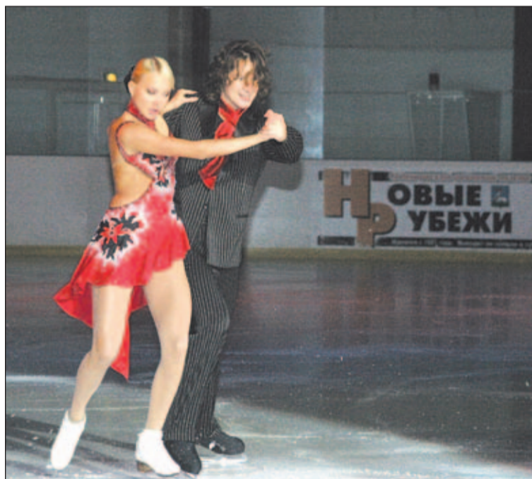
• С этого льда начались большие победы серебряных призеров Европы Оксаны Домниной и Максима Шабалина.

готовки американского и нашего хоккея. Сюда войдут команды ОГУ, наших девушек-хоккеисток и несколько возрастных команд мальчиков. Если ранее стояла задача на оздоровление, то сегодня она еще будет работать на цель и результат. Чтобы получить чемпионов через 10 лет, их надо воспитывать сегодня.