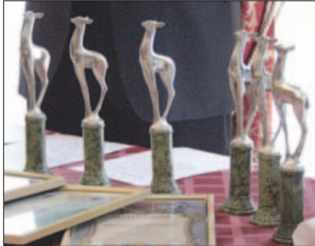
• Вот такие они — «Серебряные лани» для самых любимых журналистами спортсменов.

В НАЧАЛЕ ЦЕРЕМОНИИ награждали не репортеров, а героев их публикаций. Федерация спортивных журналистов России (ФСЖР) вручала традиционные статуэтки «Серебряных ланей» десятке лучших спортсменов 2006 года. Они достались: Екатерине Гамовой (волейбол), Николаю Давыденко (теннис), Евгению Дементьеву (лыжные гонки), Светлане Журовой (конькобежный спорт), Елене Исинбаевой (легкая атлетика), Светлане Ишмуратовой (биатлон), Татьяне Лебедевой (легкая атлетика), Владимиру Крамнику (шахматы), Евгению Плющенко (фигурное катание), Марии Шараповой (теннис). Лучшей командой года журналисты признали женскую сборную по волейболу. Лучшим тренером — Шамиля Тарпищева (теннис).