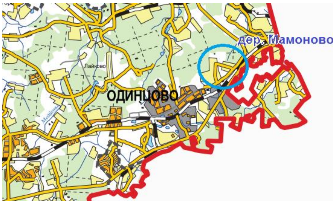
Рисунок 2.8.1. Фрагмент Схемы развития и размещения особо охраняемых природных территорий в Московской области

В соответствии со Схемой развития и размещения особо охраняемых природных территорий в Московской области, утвержденной постановлением Правительства Московской области от 11.02.2009 № 106/5, в границах д. Мамоново и на смежных территориях отсутствуют особо охраняемые природные территории федерального и регионального значения, и их организация Схемой не предусматривается (рисунок 2.8.1).